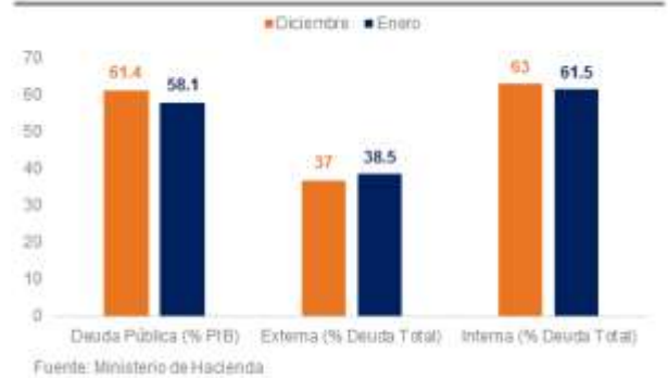
Colombia: GNC (% PIB)

De acuerdo con las cifras del Ministerio de Hacienda y Crédito Público, en enero del 2021 la deuda pública se situó por encima del 58,1% del PIB. En términos nominales, la deuda pública llegó a $632,18 billones de pesos (subiendo frente a los $619,5 billones en diciembre) cerca de $177.6 mil millones de dólares. La deuda interna representó el 61,5% de la deuda total (63% en diciembre), alrededor de $388,59 billones de pesos, es decir US$10.172 millones de dólares. Mientras tanto la deuda externa se ubicó en el 38,5% (37% en diciembre), $243,59 billones. En general, notamos que entre 2019 y 2020 se observó un incremento de 12,8 puntos porcentuales en el stock de deuda. En Itaú creemos que el frente fiscal representa un desafío para la economía colombiana en el corto plazo. El déficit fiscal se ubicaría en 8,9% del PIB en 2020, una cifra mucho mayor que el 2,5% registrado en 2019.