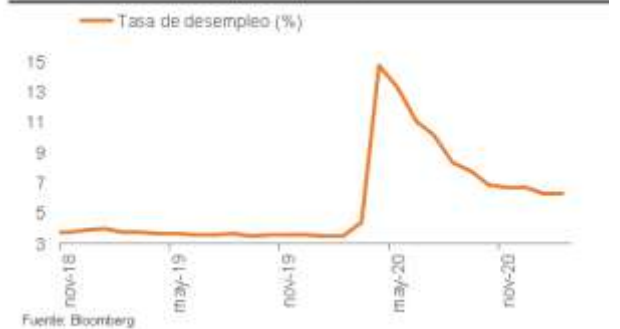
EE.UU: tasa de desempleo (% a/a)